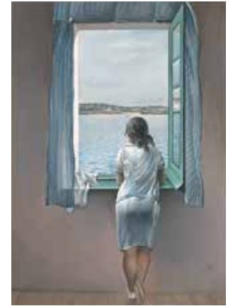
Noia a la finestra, 1925

Com en molts altres retrats de la germana de la mateixa època, la figura apareix representada lleugerament d'esquena i mostrant el rostre de perfil. Asseguda, amb les cames encreuades i les mans sobre la falda, es reclina en una cadira de reminiscències cubistes. Aquesta vegada la llum no és frontal, sinó que emana del fons de l'obra, de la finestra i de la part superior del llenç.