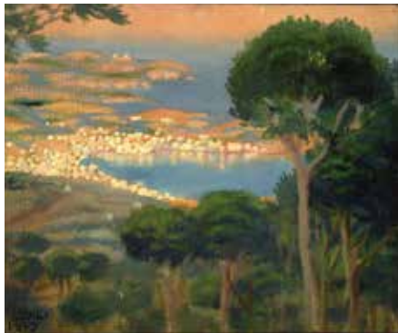
Paisatge de Cadaqués, c. 1921

El mateix Dalí es refereix posteriorment a aquest període primerenc d'experimentació constant que es fa palès en la mostra de les Dalmau: «Jo pintava els paisatges de Cadaqués, el meu pare, la meva germana, tot estava subjecte al meu frenesí. M'interessava per la pintura de Chirico, a través de les revistes. Col·laborava en la Gasetta de les Arts de Barcelona i a L'Amic de les Arts ; i tenia un llibre que no abandonava la meva capçalera: els Pensaments d'Ingres. Vaig decidir extraure unes frases significatives per al text del catàleg de la meva primera exposició individual. [...] Aquesta exaltació de les belleses de l'ofici i de la tradició casaven exactament amb les meves idees. Aquesta és l'única base sobre la qual un pot erigir-se com a geni. [...] Els crítics, tot i que sempre van amb retard i ignoren la veritat, aquest cop van mostrar el seu entusiasme». 6