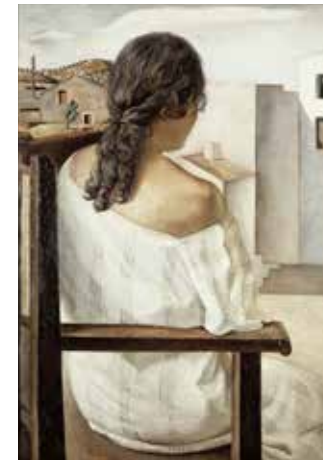
Noia asseguda, 1925