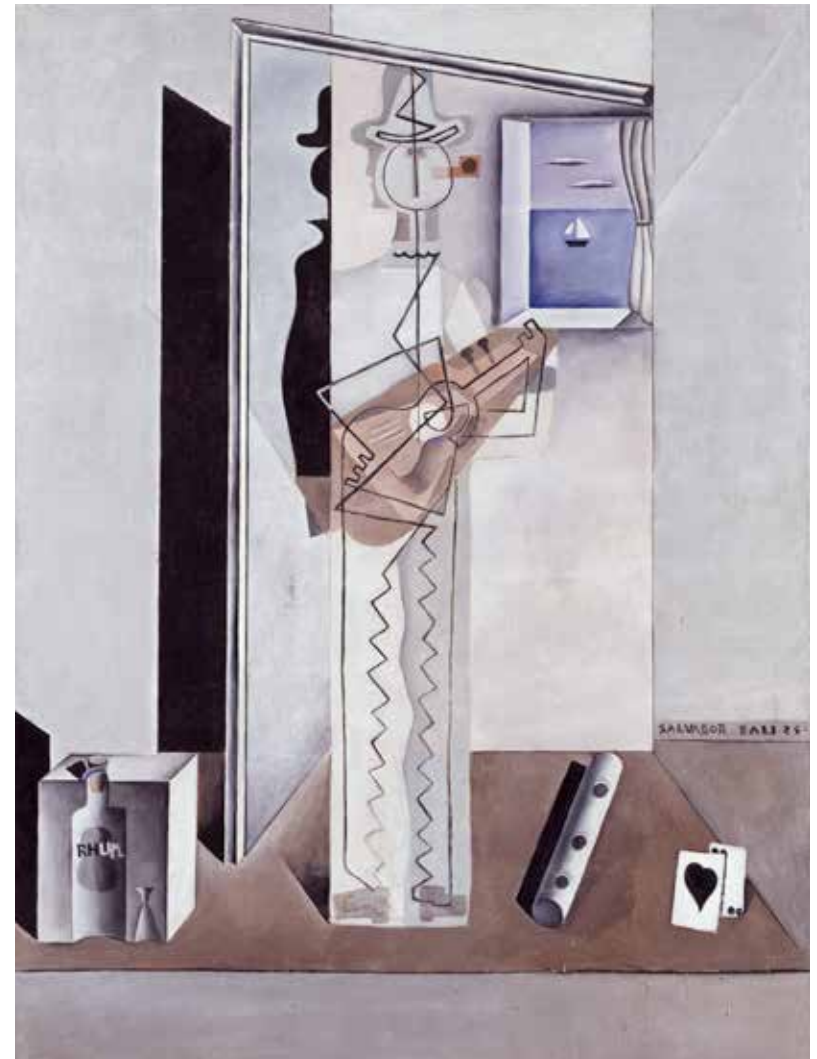
Pierrot tocant la guitarra (Pintura cubista), 1925

FIGURA DE PERFIL és un retrat, una representació que va més enllà de l'estrictament real, que destil·la la saviesa dels mestres i el desig més vehement d'experimentació. Evidencia un distanciament de l'entusiasta paleta colorista de l'impressionisme per acostar-se a les posicions del cubisme i de la revista Valori Plastici , tot emmarcat en un paisatge d'allò essencial, d'allò etern, que esdevindrà icònic, el de Cadaqués. Un retrat que prediu Salvador Dalí, com el prediuen també els altres quatre olis, tots propietat de la Fundació Gala-Salvador Dalí, que l'acompanyen i el complementen i que exemplifiquen, ben clarament en aquesta mostra, l'època d'aprenentatge de Salvador Dalí.