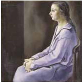
Retrat de la meua germana, 1925