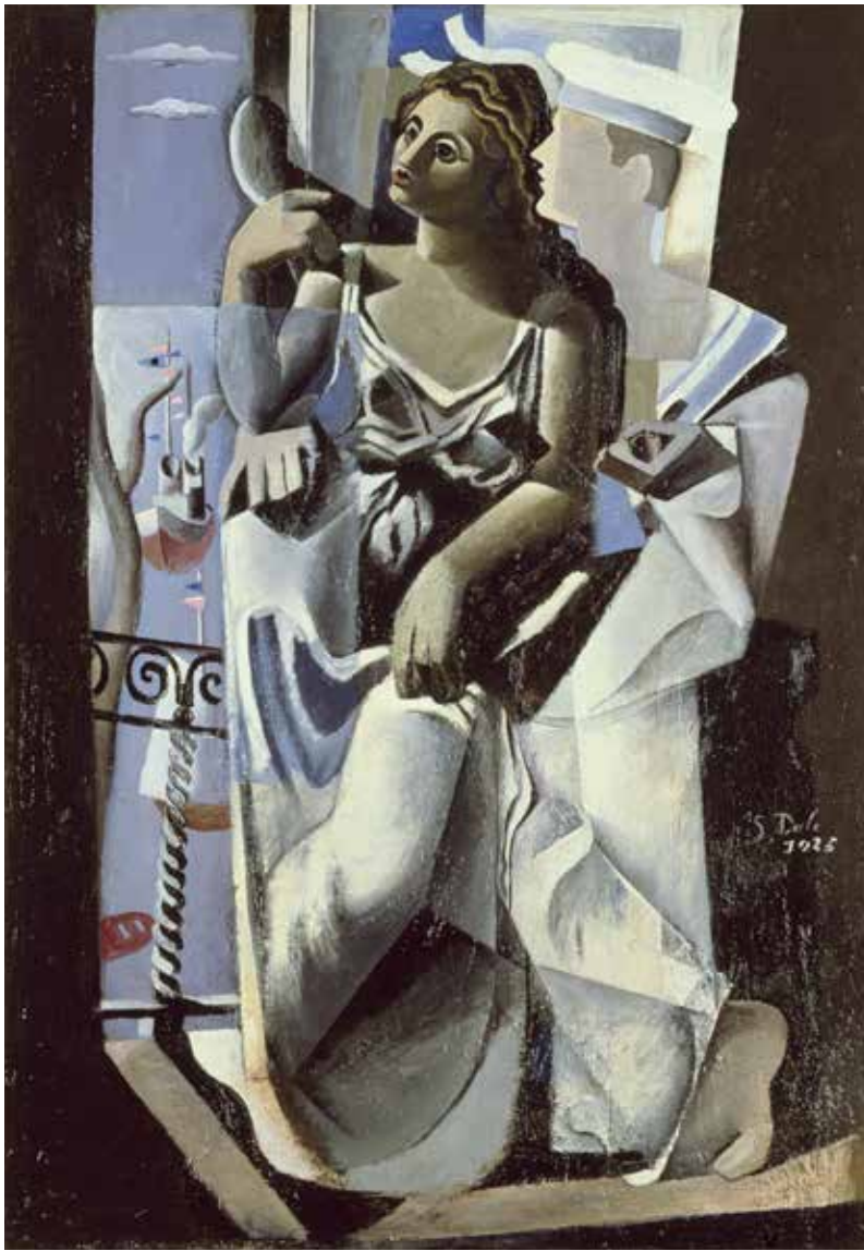
Venus i un mariner (Homenatge a Salvat-Papasseit), 1925

cauen minuciosament sobre l'espatlla descoberta. Sembla un dia d'hivern en què el temps s'ha diluït en la serenitat del paisatge i en la calma que traspuia la figura, il·luminada amb delicadesa en el rostre, el coll, l'espatlla, el braç i les mans, les cames i la falda. Al mateix temps, la composició, on l'espai buit adquireix un paper determinant, s'equilibra elegantment amb la llum grisa i pàl·lida que entra verticalment per la dreta i genera una atmosfera silenciosa que envolta la figura. L'estil de la pintura metafísica italiana està plenament representat per la solidesa dels elements, la seva separació en l'espai, el diàleg secret que s'estableix entre ells, el joc i la convergència de les perspectives, la geometrització de les formes i la llum creada per les tonalitats càlides que ens recorden Giorgio Morandi.