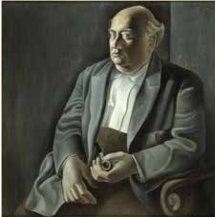
Retrat del meu pare, 1925

La suavitat dels colors s'intensifica en la zona destacada a base de pinzellades cobrents que marquen la textura del paisatge mitjançant blaus cel, blancs i ocres; en el marc de la finestra amb colors crus, blancs i verds blavosos; i en la figura i el vestit amb tonalitats de carnacions i rosades. En contrast, en les zones que romanen en la penombra de l'habitació predominen els colors foscos, grisos i marrons aplicats amb una capa pictòrica fina i diluïda, gairebé transparent en la zona de les natges.