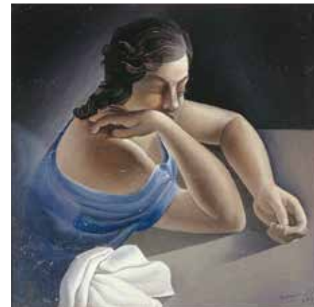
Figura en una taula, 1925

Les paraules d'Anna Maria es fan imatge en aquesta peça, on apareix representada amb un realisme pausat i corpori al centre de l'escena, al voltant de la qual gira la composició plàstica de l'obra. La simplicitat de les línies i el tractament dels espais buits de l'habitació creen una atmosfera tranquil·la. La posició de tres quarts de perfil de la noia i la direccionalitat de la seva mirada generen un moviment suau i dirigeixen tota l'atenció de l'espectador cap al quadrant superior esquerre de la peça, on hi ha el paisatge de Cadaqués, visible des de la finestra. Un paisatge clarament identificat com es Sortell, un paratge situat a l'entorn de la casa dels Pichot, família d'artistes propera als Dalí, amb el característic pont que comunica amb l'illa adjacent, i que Dalí podia contemplar des de la finestra del seu estudi a la casa paterna des Llaner. Una finestra que deixa aflorar un paisatge encalmat, configurat mitjançant els dictàmens geomètrics de la mesura, a partir del domini d'una observació detallada i metafísica.